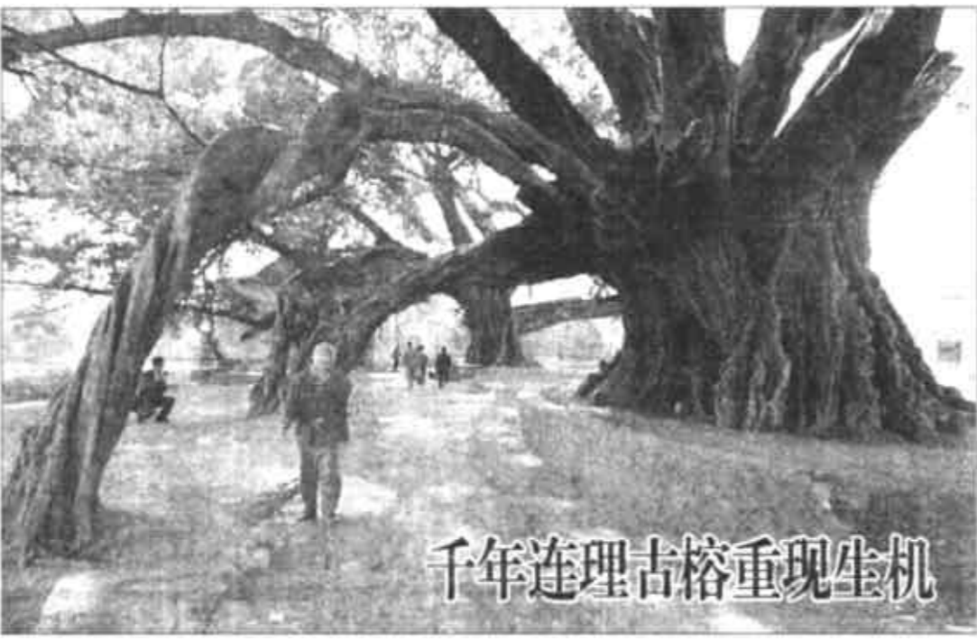
千年连理古榕重现生机

广西平乐县张家镇榕津村千年连理古榕的4个天然拱门奇观。广西平乐县张家镇榕津村群众近年来自筹资金保护世界罕见的千年连理古榕,使几度遭遇火灾的古榕又重现生机。古榕现在不仅长出几处新的气根,而且还冒出了新叶。千年连理古榕据说种植于北宋年间,目前其树冠达9米,树高20米,树冠覆盖面积约200平方米,其气根凌空扎地,形成4个整齐、匀称的高约5米的天然拱门奇观。